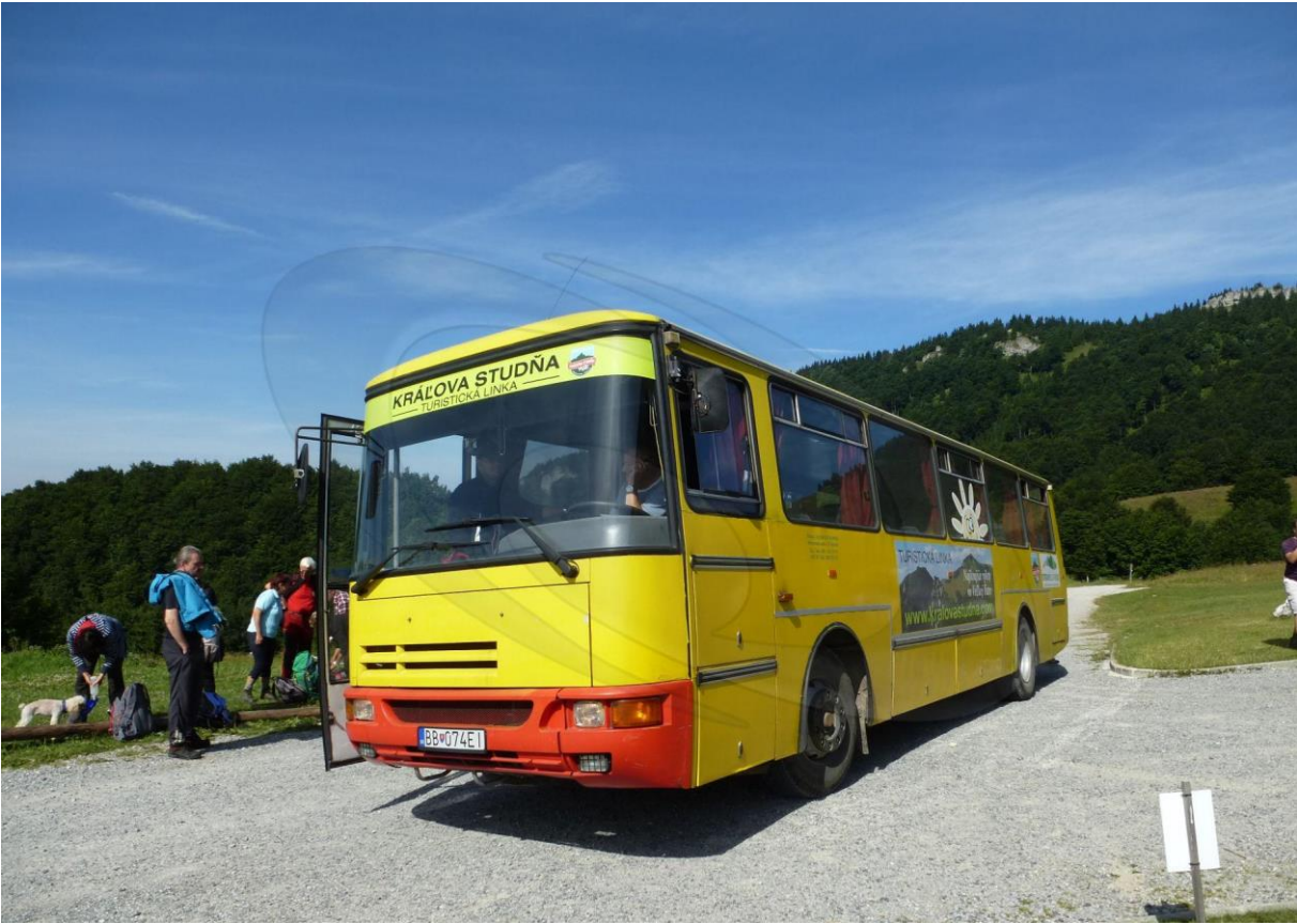
Karosa C 934 , ŠPZ BB-074EI